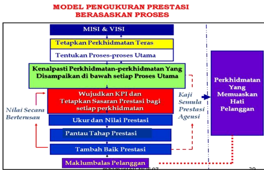
Rajah 2: Model Pengukuran Prestasi Berasaskan Proses